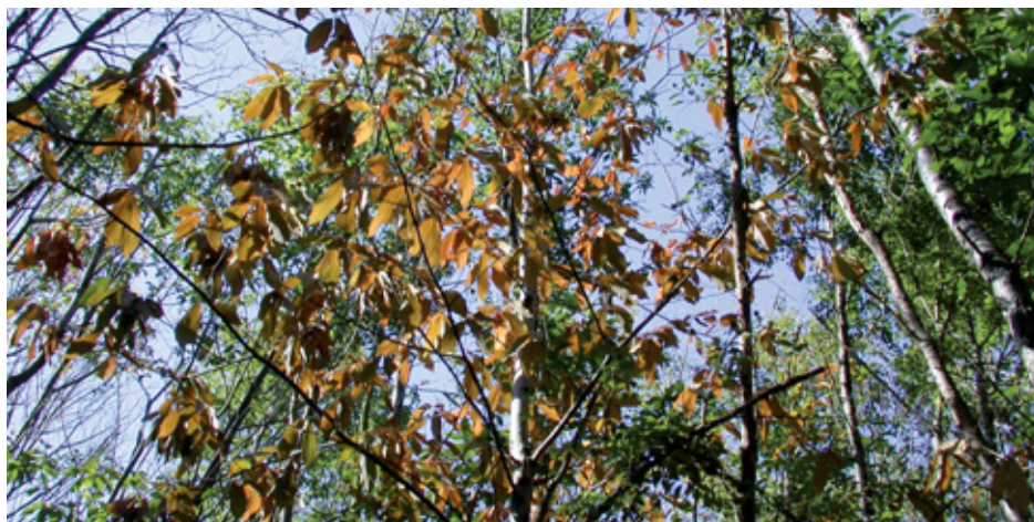
Dépérissement dans un peuplement de châtaignier

L'année 2007 n'a pas été marquée par des problèmes phytosanitaires majeurs, la saison estivale ayant été très arrosée. Avec une pluviométrie exceptionnelle les peuplements forestiers ont pu en général bénéficier de très bonnes conditions de végétation qui se sont traduites par des croissances en hauteur souvent hors du commun pour le douglas, le châtaignier ou le mélèze. Dans ce contexte favorable les arbres sont plus résistants à bon nombre de problèmes sanitaires.