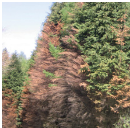
Dépérissement sur cyprès de Lawson

Dans le Finistère centre et le Morbihan des cas de dépérissement de Cyprès de Lawson sont signalés depuis 3-4 ans. Ce phénomène spectaculaire touche aussi bien les peuplements purs, mélangés ou les alignements. Plusieurs investigations ont été menées sur les cas existants sans qu'aucun pathogène n'ait été identifié à l'exception d'un cas dans le Morbihan où le fomes a été diagnostiqué.