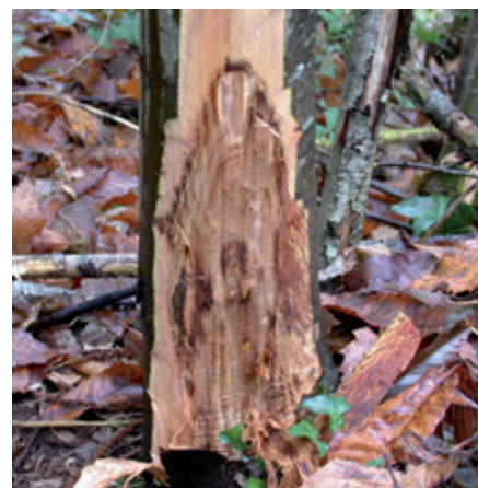
Attaque d'encre sur châtaignier

De nombreux dépérissements de tiges de châtaignier sont observés souvent de façon isolée dans les peuplements forestiers, sans pouvoir les attribuer à un ravageur particulier. Par contre, si le phénomène concerne plusieurs arbres formant notamment des tâches de dépérissement, la suspicion de maladie de l'encre n'est pas négligeable.