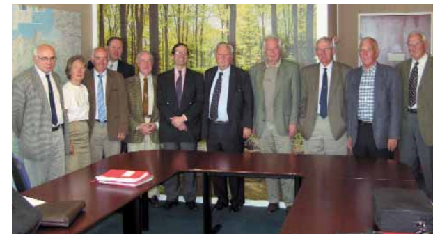
Membres titulaires du conseil de Centre

Vos élus au conseil d'administration du CRPF représentent la forêt dans les différentes instances où elle entre en jeu.