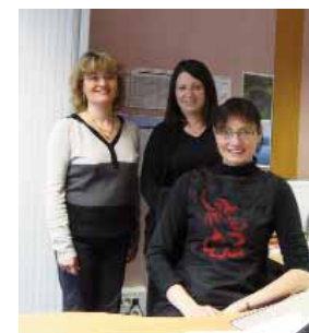
Le personnel administratif est à votre service au siège.