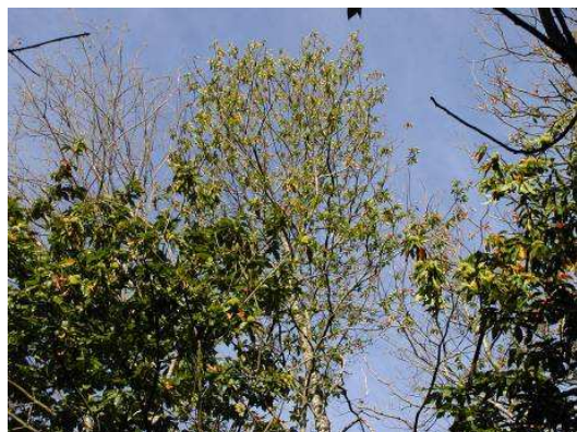
encre du châtaignier