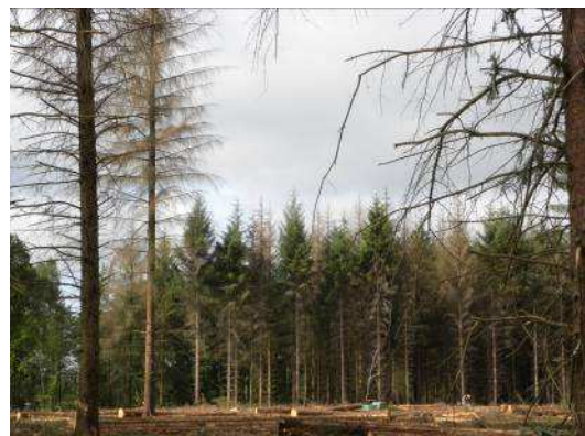
attaque du dendroctone de l'épicéa

Ces correspondants-observateurs sont à votre disposition pour toute information complémentaire et éventuel diagnostic relatif à la santé des forêts