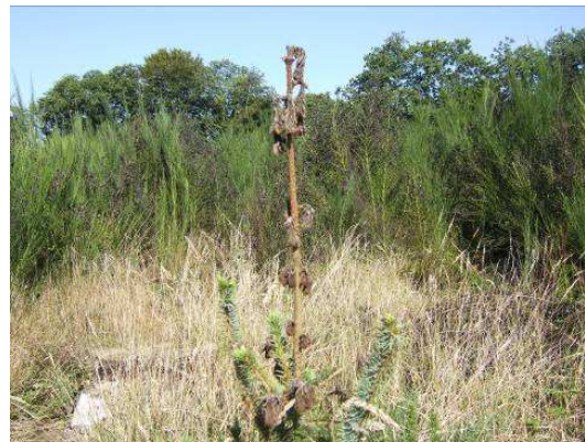
dégât dû au gel sur épicéa de sitka