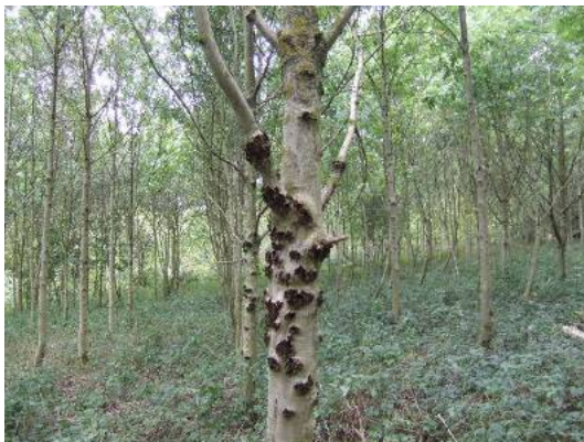
chancre du frêne

Ce bilan est la synthèse de leurs observations de l'année 2010