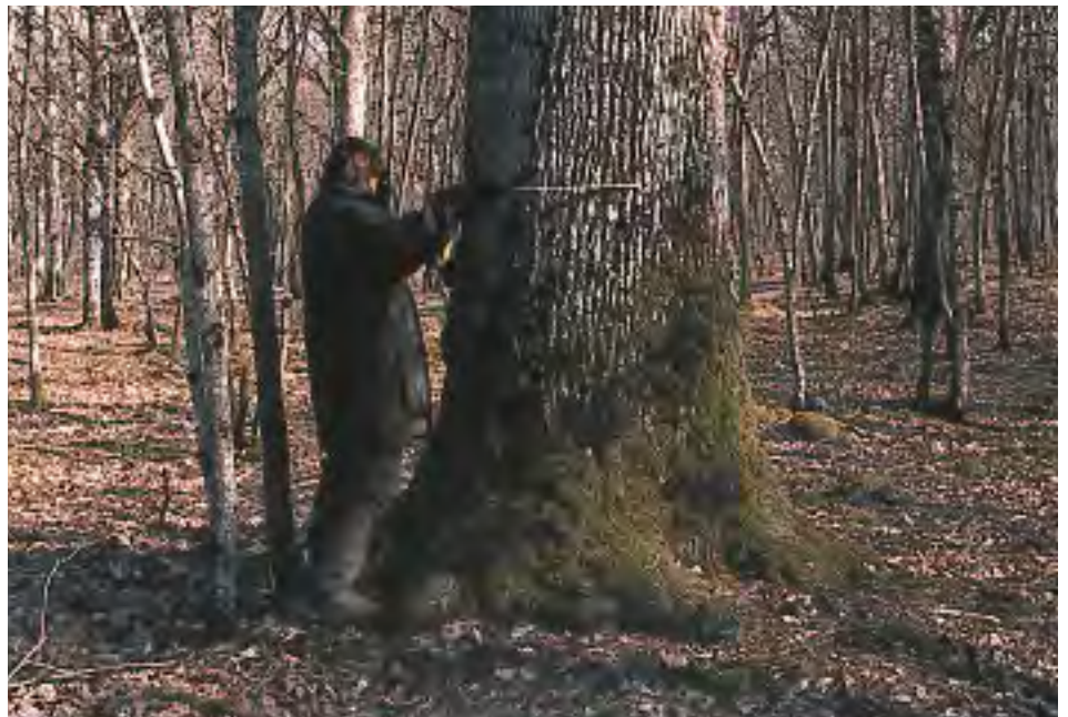
Mesure du diamètre au compas forestier.

La circonférence s'exprime en classe de 10 cm. Le diamètre en classe de 5 cm. Ces classes sont désignées par leur dimension médiane.