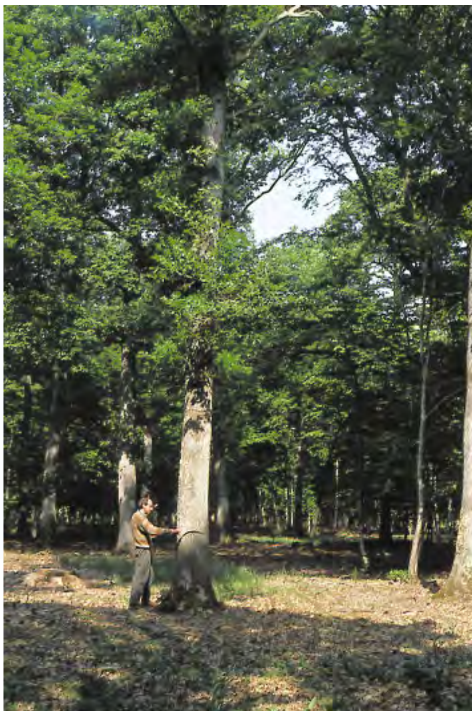
Circonférence à 1,30 m au ruban.

Elle s'exprime en mètre entier, par excès ou par défaut. Elle peut s'apprécier au jugé ou en ayant recours à des instruments de mesures appelés dendromètres.