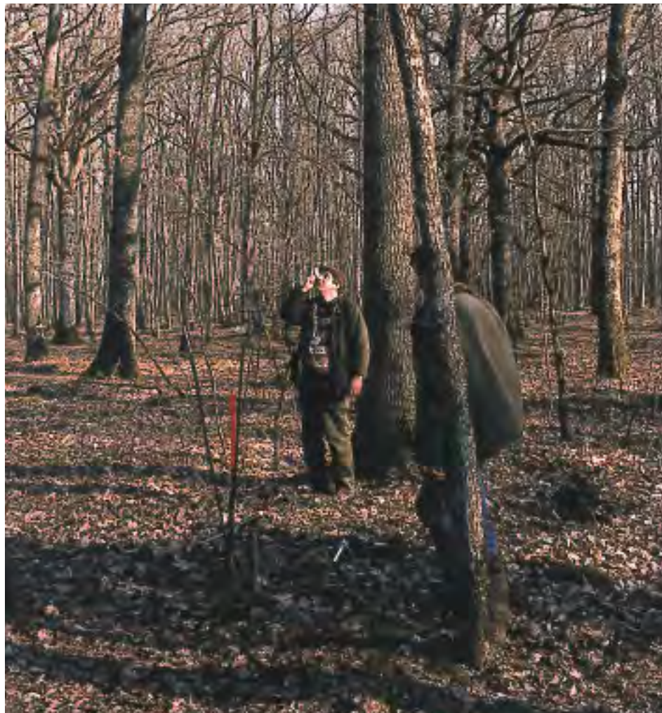
Mesure de la hauteur au dendromètre.

On enlève 1 m à la longueur de la grume, car on considère que la mesure de la grosseur est prise à 1 m au dessus de la section d'abattage.