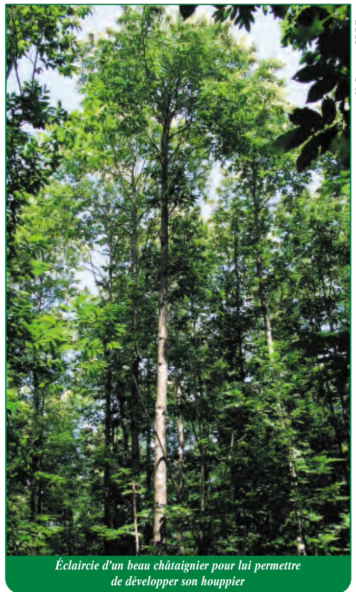
Coupe de régénération