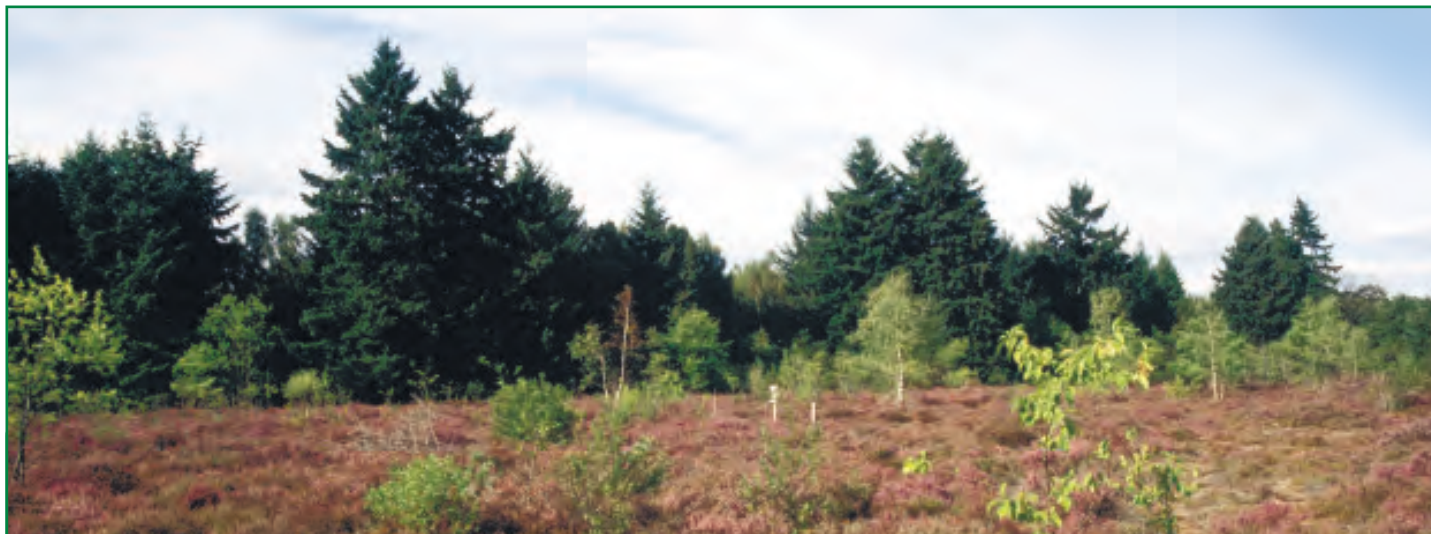
Lande à Callune