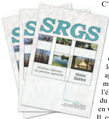
Couverture du SRGS