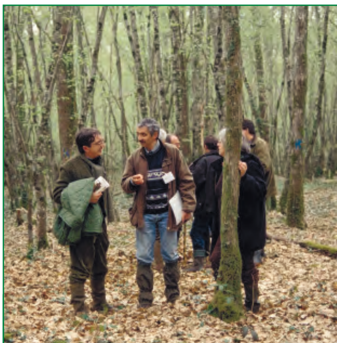
Les techniciens forestiers à votre écoute

Le code des bonnes pratiques sylvicoles est considéré comme étant une présomption de garantie de gestion durable : y adhérer ne suffit pas pour répondre à certaines obligations.