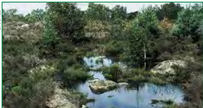
Lande et mare de Coquibus (91).

Accorder une vigilance particulière aux stations humides ou sèches peu productives qui peuvent être des milieux biologiquement riches et originaux. Maintenir leur régime hydrique et éviter de les boiser sont souvent des mesures de bon sens à la fois sur les plans économique et environnemental.