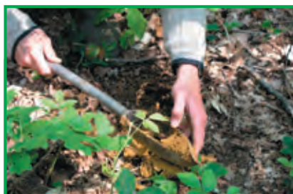
Appréciation de la terre fine au toucher