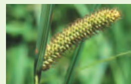
La laïche des marais : espèce de milieu humide