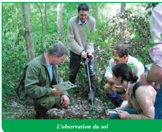
L'observation du sol

Une observation sur 60 à 80 cm de profondeur est suffisante, sauf dans les cas où il est utile de connaître le niveau estival de la nappe d'eau. Si vous choisissez de creuser un trou, il faut vous équiper d'une bêche ou d'une pioche (Cf. fiche "Le petit matériel du sylviculteur").