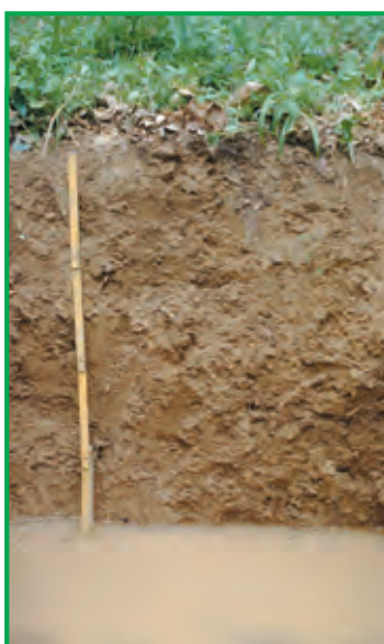
Sol hydromorphe à engorgement temporaire

Un engorgement est d'autant plus défavorable qu'il dure longtemps et qu'il est proche de la surface du sol. Deux critères essentiels sont à évaluer pour estimer l'importance de la contrainte : l'intensité et la profondeur de l'engorgement.