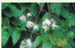
La clématite : espèce de milieu calcaire