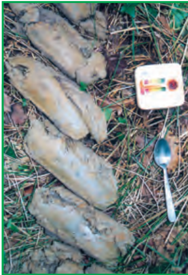
Carottes argileuses prélevées à la tarière

Pour la reconnaître : à l'état humide, elle colle aux doigts et a la consistance de la pâte à modeler. Il y a beaucoup d'argile dans l'horizon du sol (teneur > à 30%) quand il est possible de former un petit boudin de terre entre les doigts puis de modeler un anneau sans qu'il ne se brise. A l'état sec, l'argile forme des blocs durs.