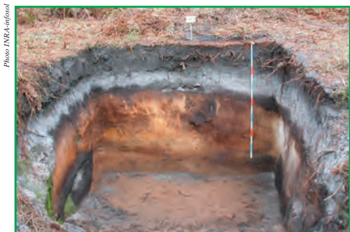
Enracinement superficiel évitant la couche claire appauvrie